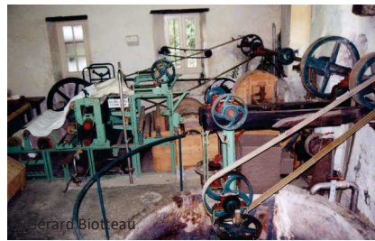
Moulin de la Bouzique (Dordogne)

faut rappeler que cette énergie électrique est produite avec une technique et dans des bâtiments qui tout au début servaient à écraser le blé. Les chercheurs de nos instituts ont en effet découvert que pour que les processus biologiques d'autoépuration de l'eau se mettent en place, il faut que l'eau ralentisse dans la rivière, et que fait le seuil, il ralentit l'eau. L'eau qui sort du moulin est plus propre que celle qui entre. Sachant qu'ils sont disséminés sur tout le territoire, on peut aisément imaginer que cet impact est important dans nos rivières polluées par les nitrates, le phosphore et certains pesticides.