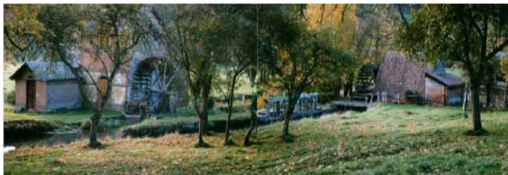
Les Moulins Normands-Picards